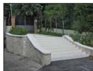
Scala colle Sant'Antonio