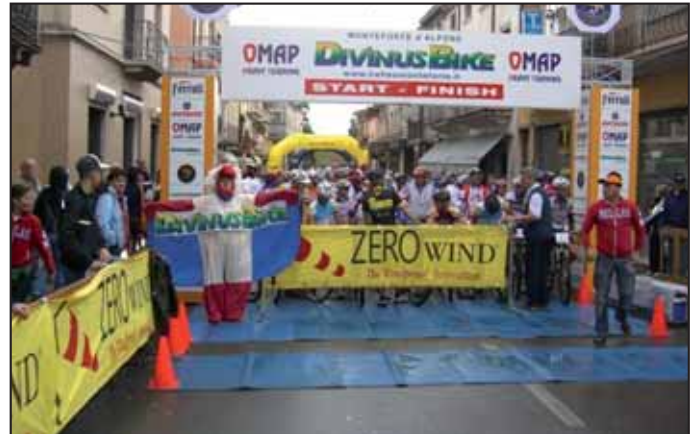
Partenza Divinus Bike

Tutti i ragazzi sono stati premiati con una medaglia e una maglietta ricordo.