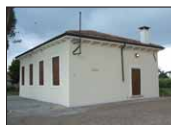
Scolette di Sarmazza