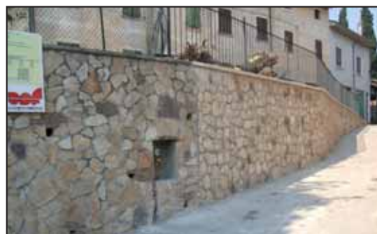
Il nuovo muro in via Garibaldi