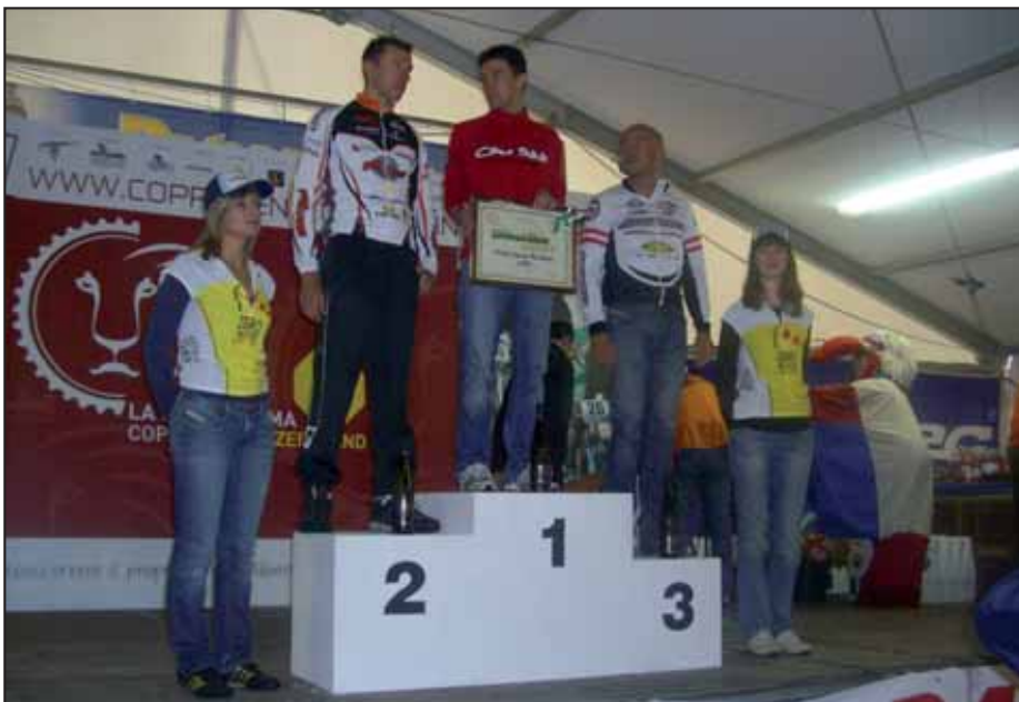
Sul podio i tre Biker premiati