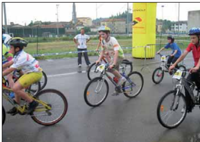
Partenza Divinus Boys