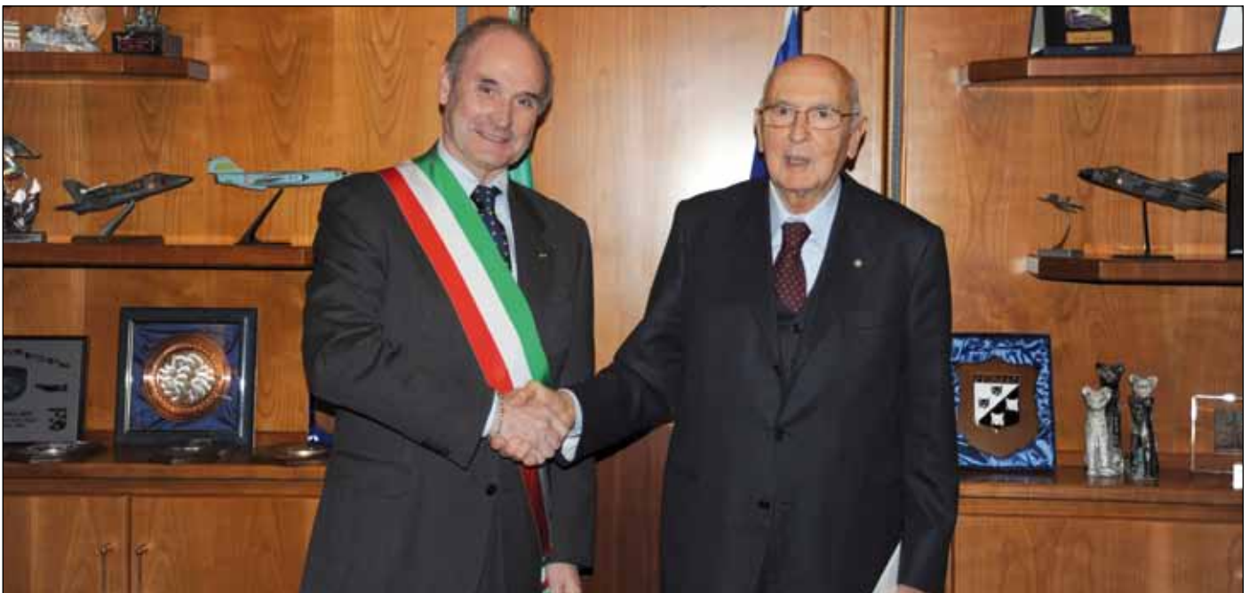
Il presidente Giorgio Napolitano incontra il sindaco Carlo Tessari in occasione dell'alluvione.