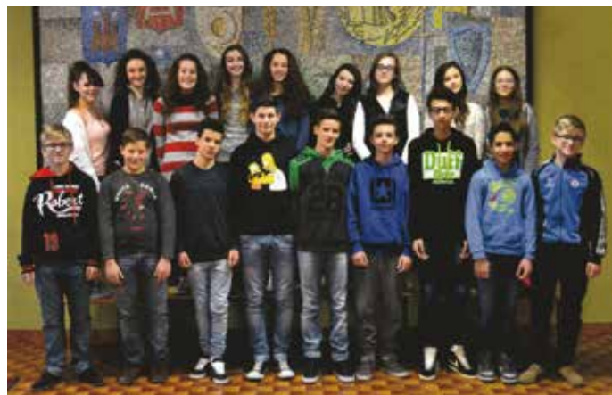
I Ragazzi della Terza C