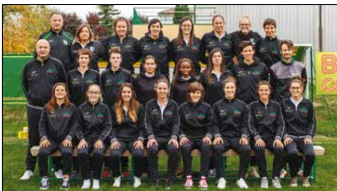
Squadra Femminile "Pro Hellas Monteforte" che ha conquistato la serie B