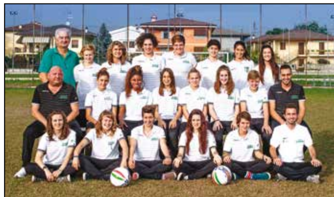
Squadra Primavera Femminile che ha conquistato il primo scudetto di categoria