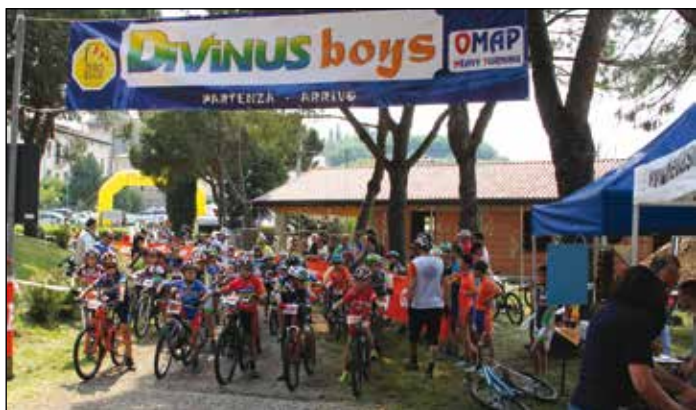
Partenza della Divinus Boys